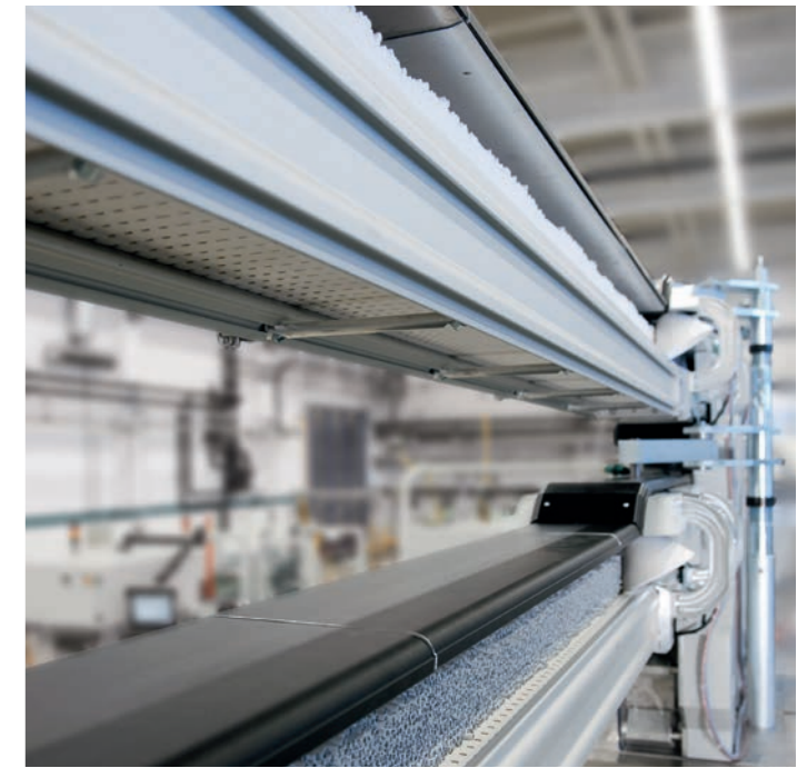
Transfersystem RTS für Filter oder Zigaretten